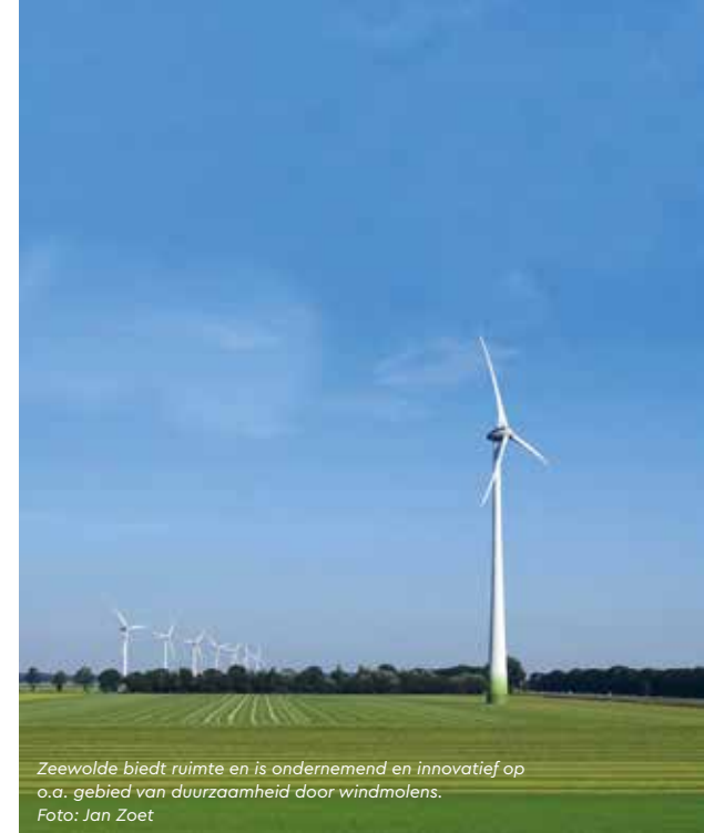
Zeewolde biedt ruimte en is ondernemend en innovatief op o.a. gebied van duurzaamheid door windmolens.

Een gedeelde zorg en grote opgave is het stikstofprobleem. Bedrijven die willen groeien moeten wel in de regio kunnen blijven, opperde Pieter de Boer van Horizon Invest in Flevoland. Omdat er grote verschillen tussen de drie gemeentes