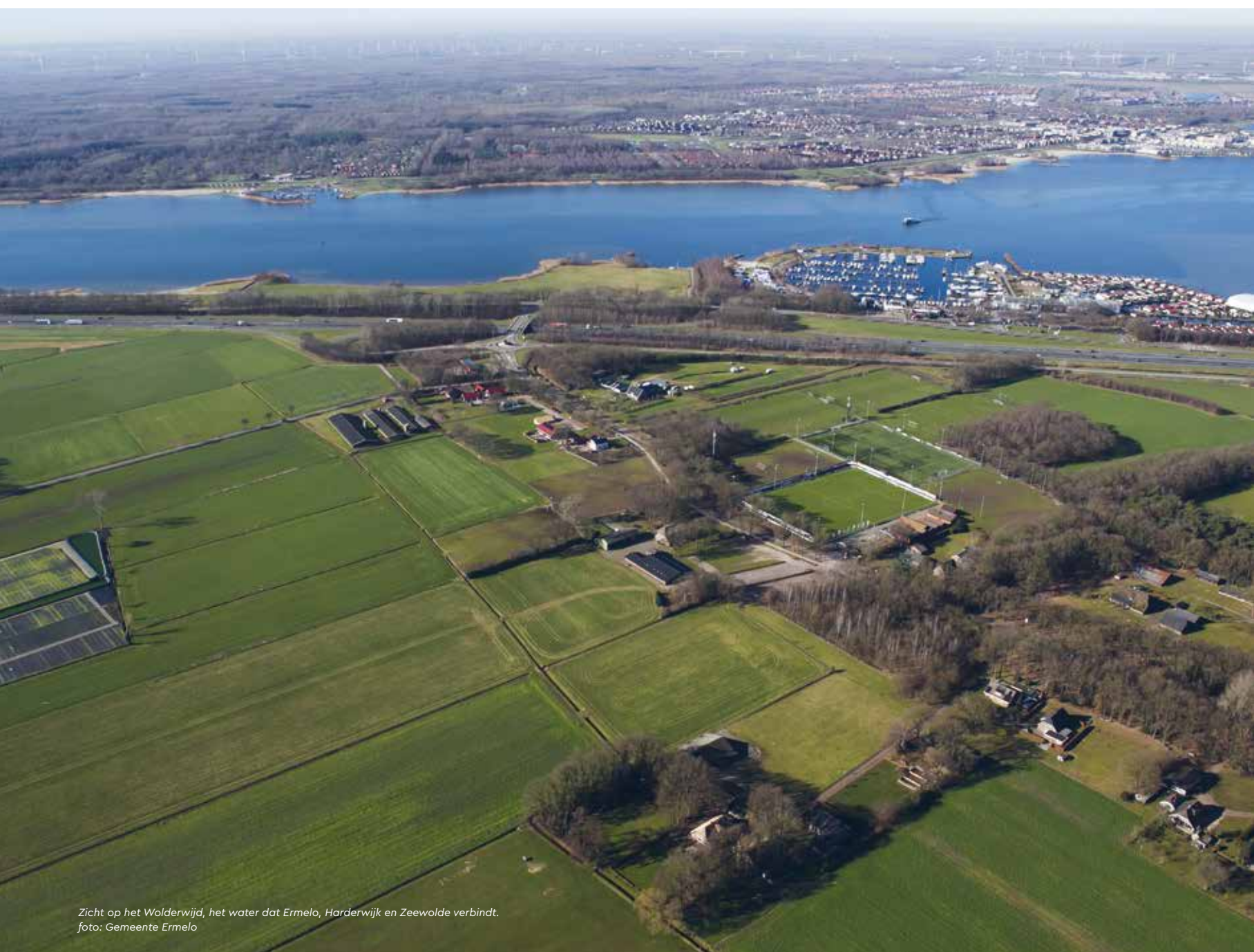
Zicht op het Wolderwijd, het water dat Ermelo, Harderwijk en Zeewolde verbindt.