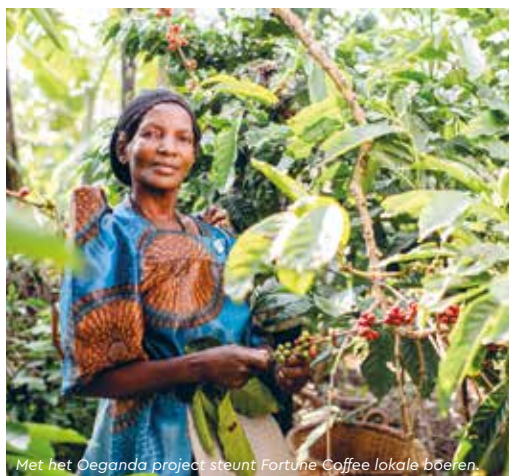
Met het Oeganda project steunt Fortune Coffee lokale boeren.